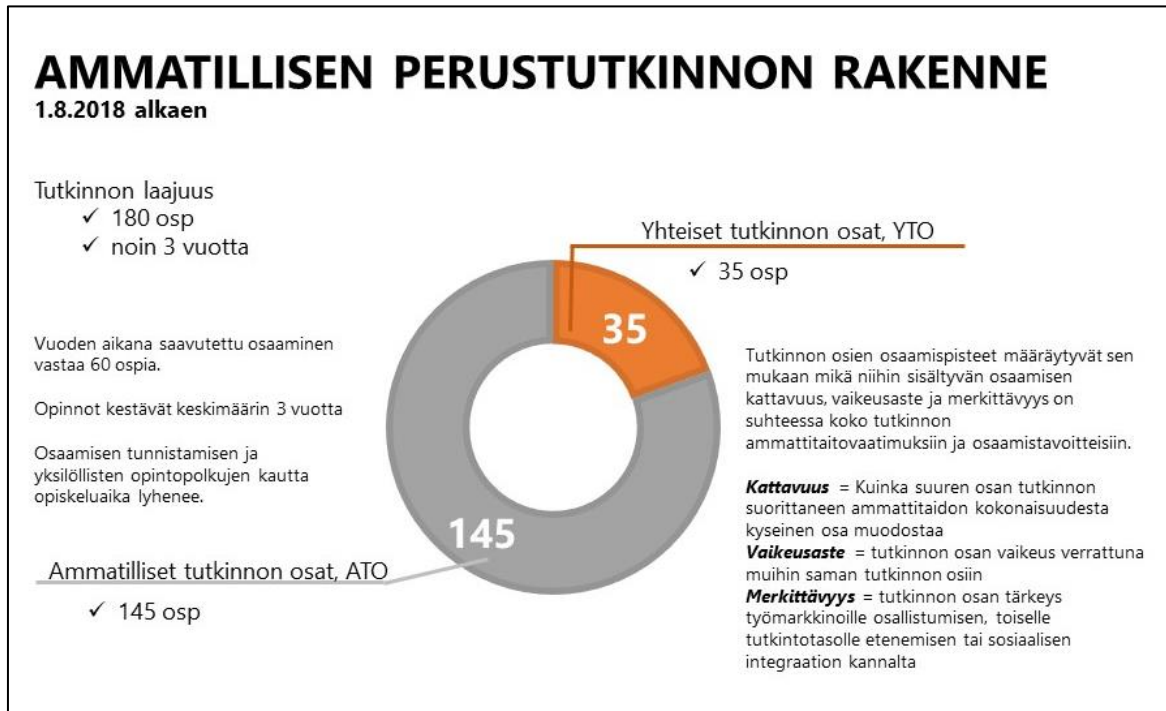
Kuvio 1. Perustutkinnon rakenne

Perustutkinnot muodostuvat ammatillisista tutkinnon osista ja yhteisistä tutkinnon osista (yto).