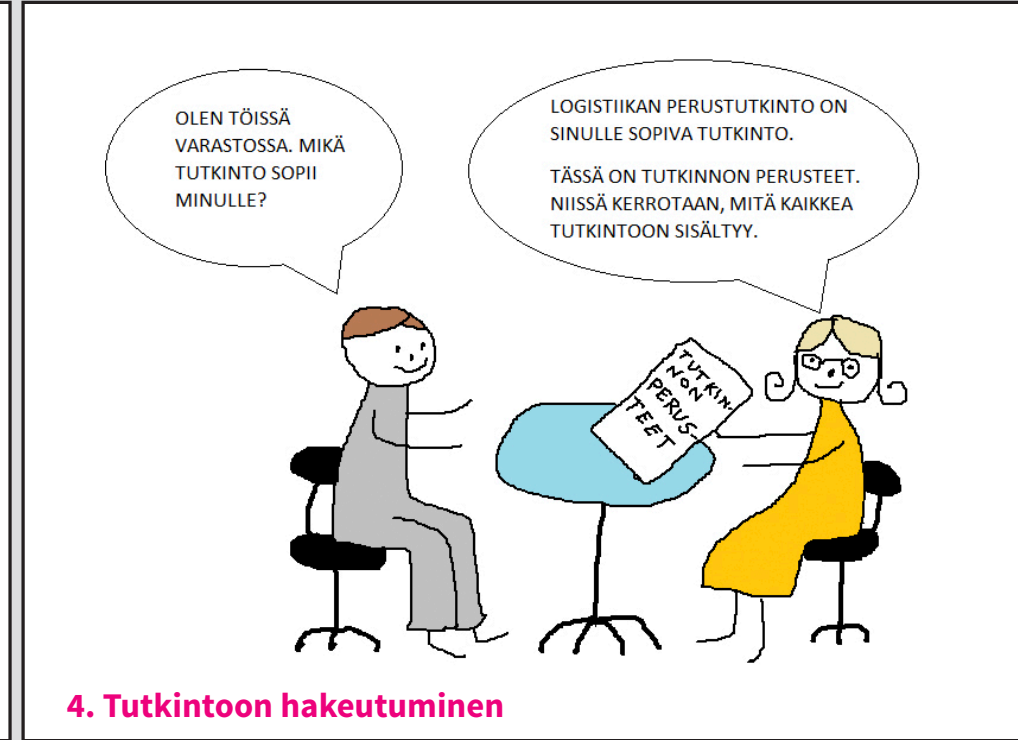
4. Tutkintoon hakeutuminen