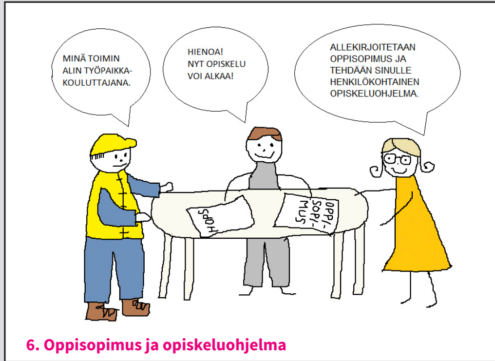
6. Oppisopimus ja opiskeluohjelma