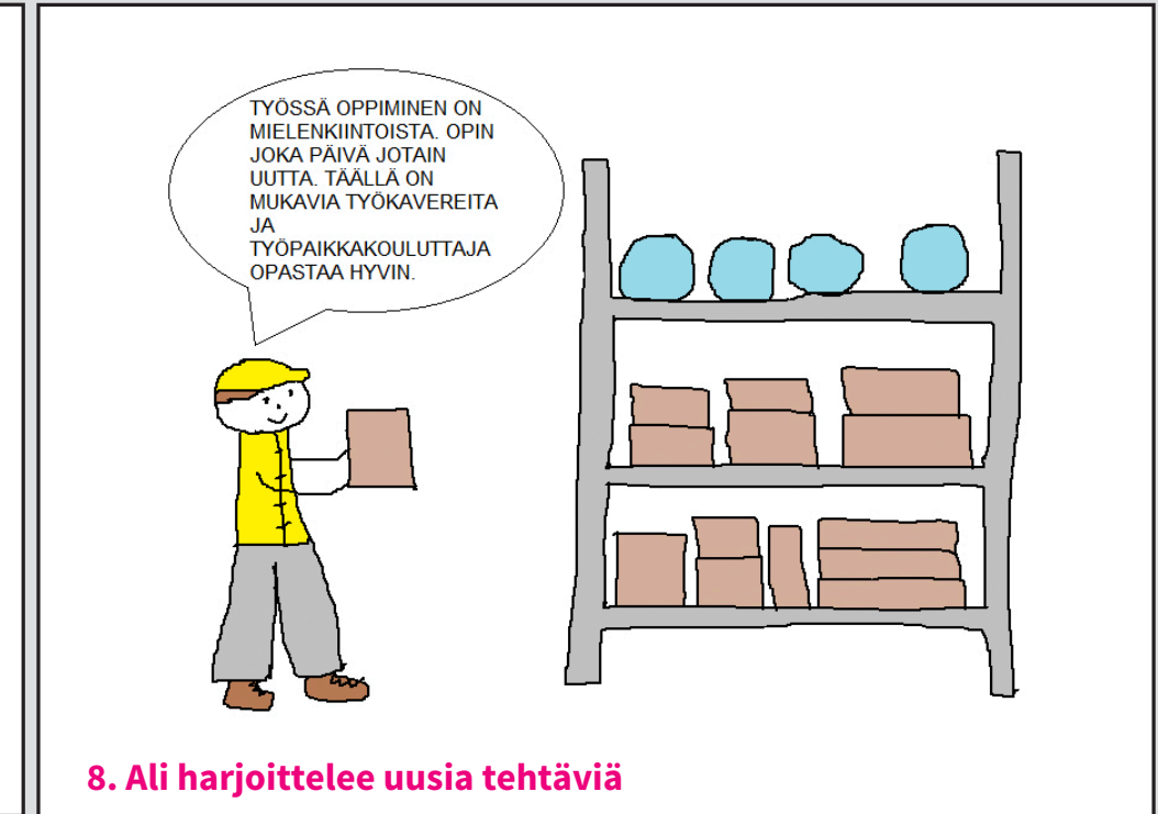
8. Ali harjoittelee uusia tehtäviä