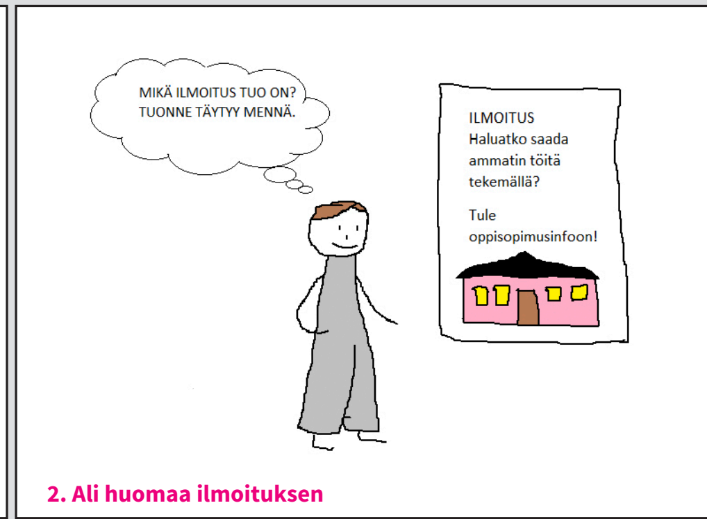
2. Ali huomaa ilmoituksen