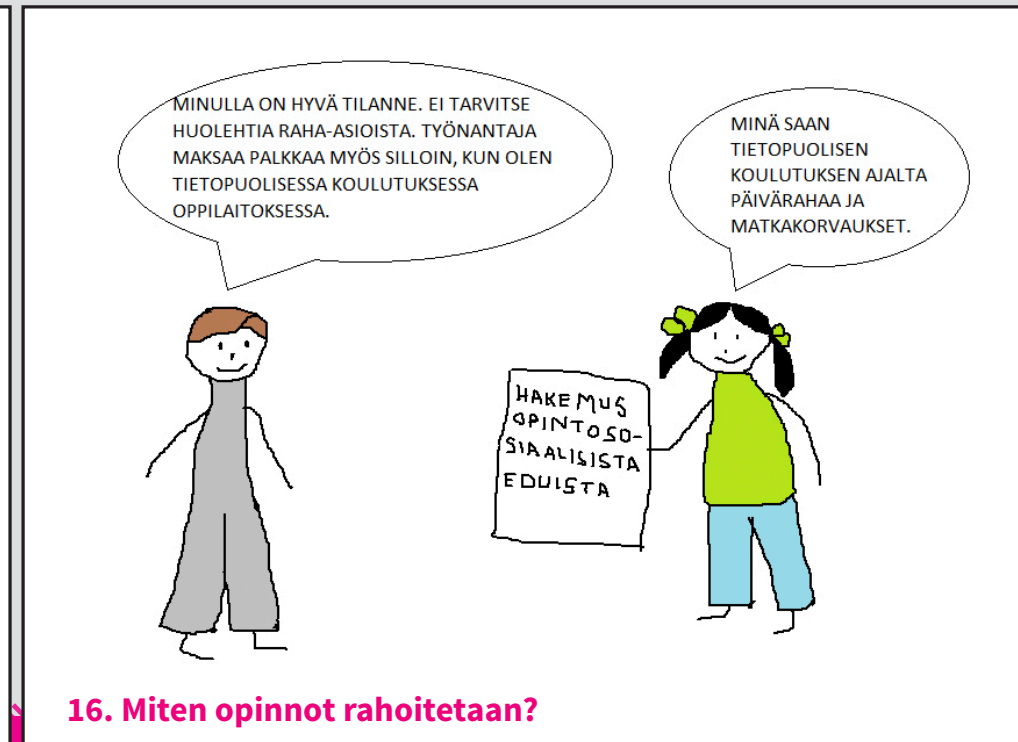
16. Miten opinnot rahoitetaan?