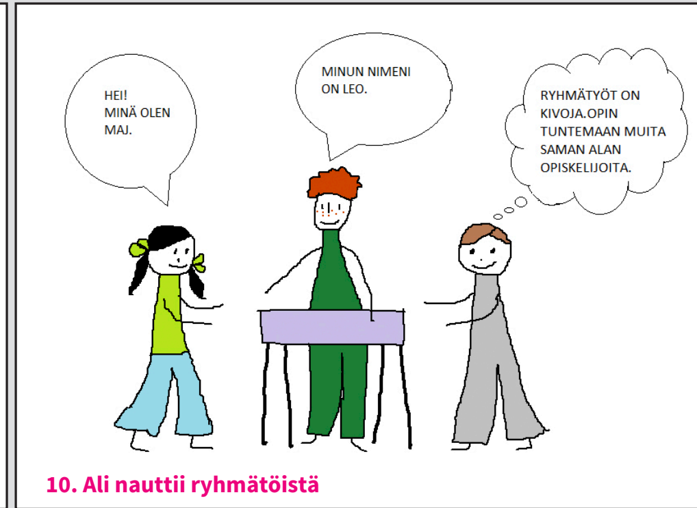
10. Ali nauttii ryhmätyöstä