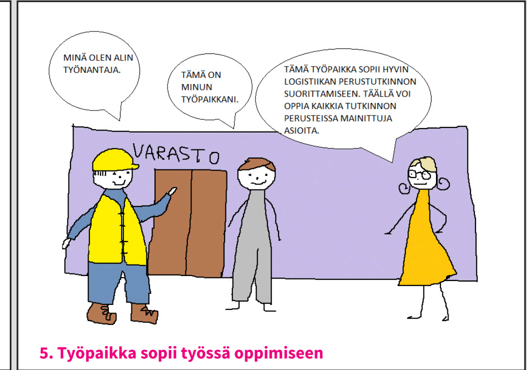
5. Työpaikka sopii työssä oppimiseen