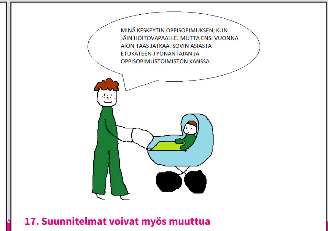
17. Suunnitelmat voivat myös muuttua