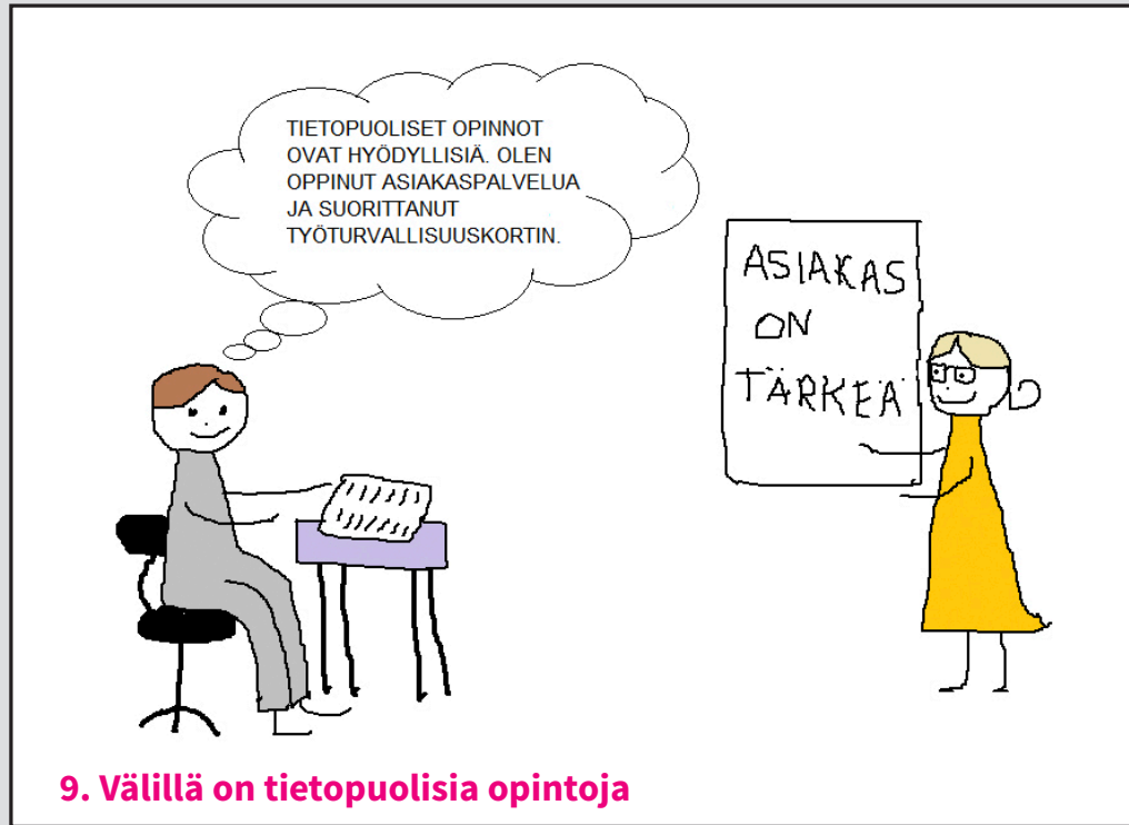
9. Välillä on tietopuolisia opintoja