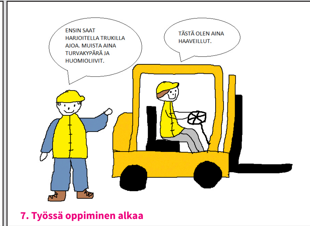
7. Työssä oppiminen alkaa