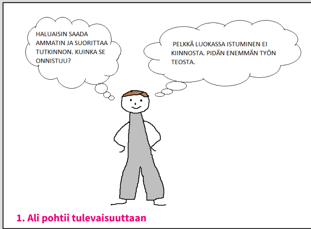
1. Ali pohtii tulevaisuuttaan