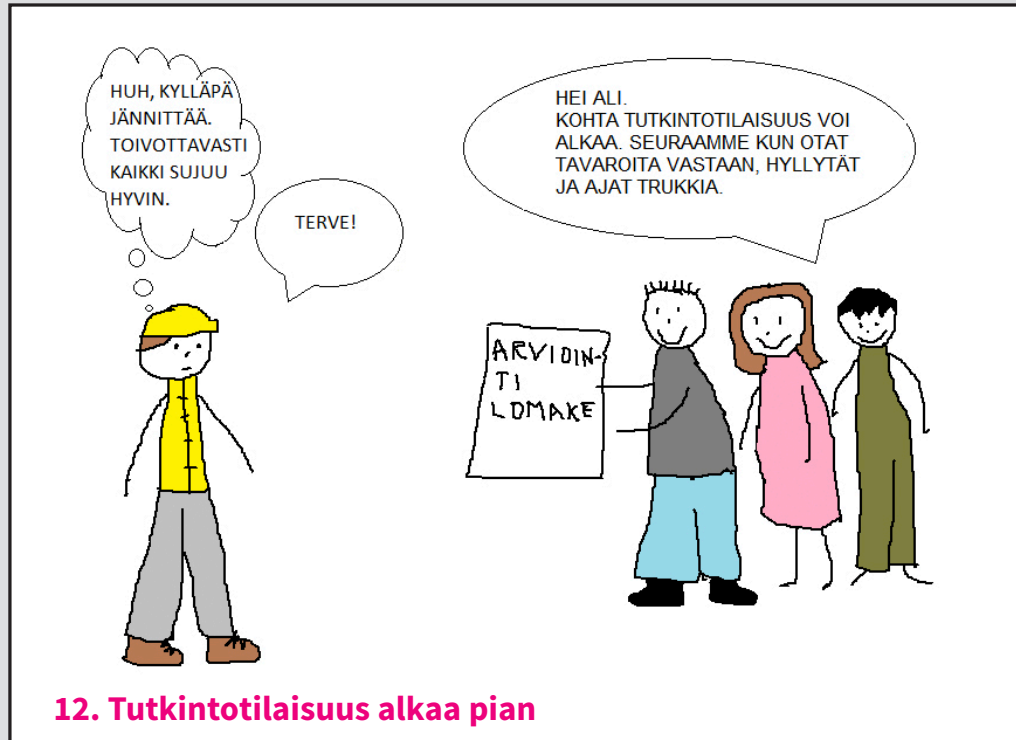
12. Tutkintotilasuus alkaa pian