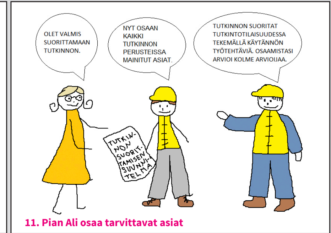
11. Pian Ali osaa tarvittavat asiat